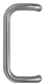
PB30 Pochwyt rurowy 100x300 Stal szlachetna (PB31 = aluminium F1) AT500