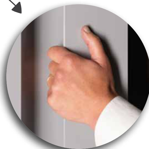
GSIV Zintegrowany pochwyt

Możliwe podświetlenie LED przy AT530 i AT540 (rys. str. 98)